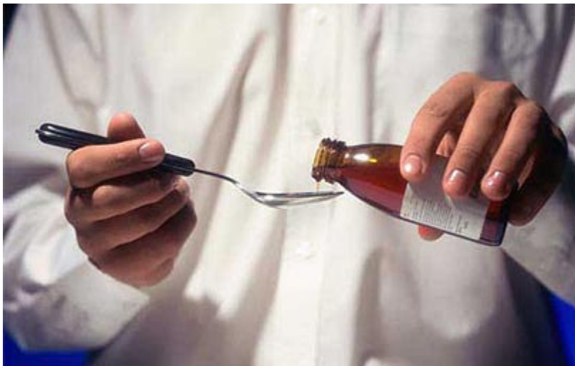
תרופות. מבית המרקחת היישר למיטת החולה

עוד בקולקציה: מחממי אנגורה, שמנים אתריים ועוד. מחירי התרופות ללא מרשם, לדברי חגי שור, מבעלי בית המרקחת, נמוכים מהמקובל; מחירי תרופות המרשם מסובסדים לפי ההשתייכות לקופת החולים.